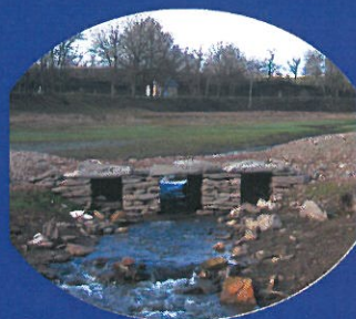
Petit pont immergé sur le ruisseau des Moulinoches