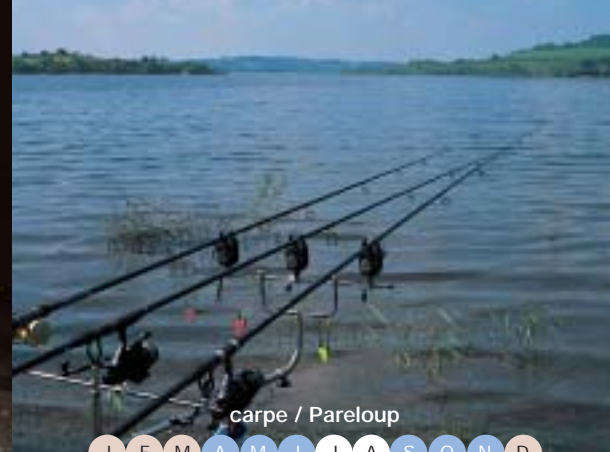
carpe / Pareloup